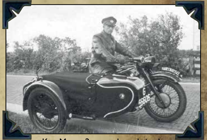
Kon.Mar. 2e verkeersbrigade Leeuwarden 1941