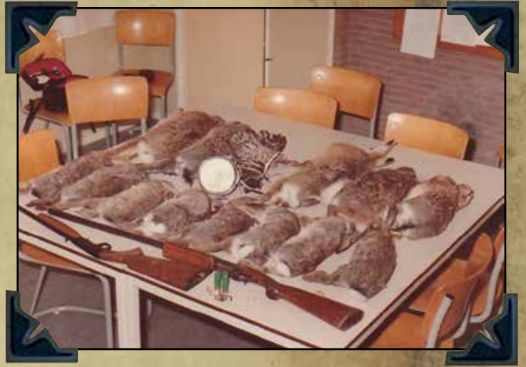
eigen regio - stropersbuit